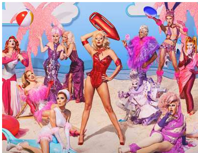
Ce vendredi sur France 2, « Drag Race France » débarque pour une saison 3.