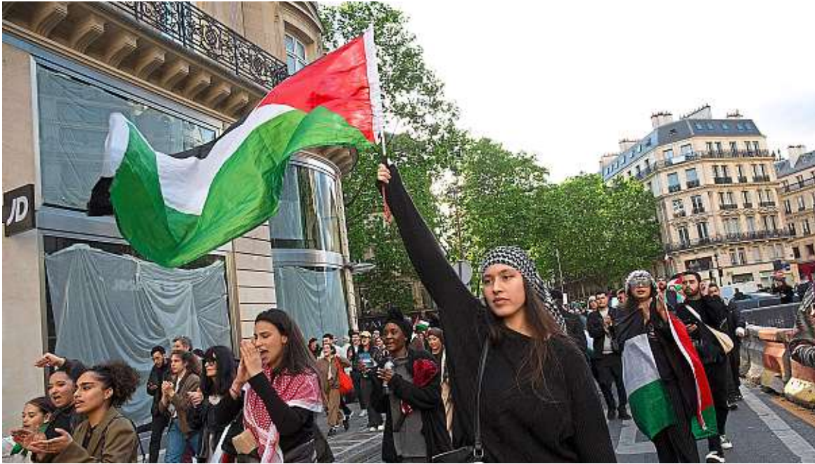
Depuis lundi, plusieurs rassemblements ont eu lieu à Paris en solidarité avec les Gazaouis.