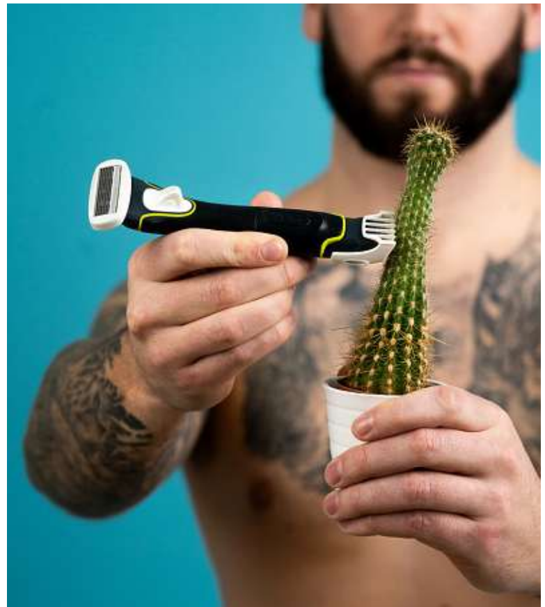
Dos, bras, jambes, sexe... L'épilation devient de moins en moins épineuse chez les hommes. Wilkinson

L'opération « place nette », si l'on peut dire, reste, quant à elle, très géolocalisée à la maison. Notons ici que 70 %