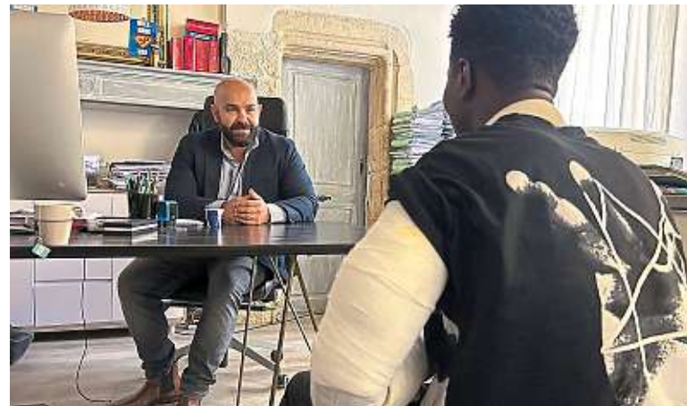
Koffi*, 19 ans, de dos, avec son avocat.