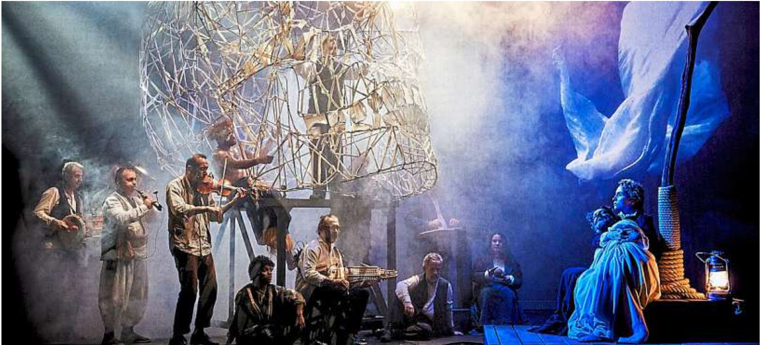
Kaldûn, pièce de Abdelwaheb Sefsaf présentée lors de Nuit blanche, met en scène la déportation des insurgés algériens vers la Nouvelle-Calédonie en 1873.