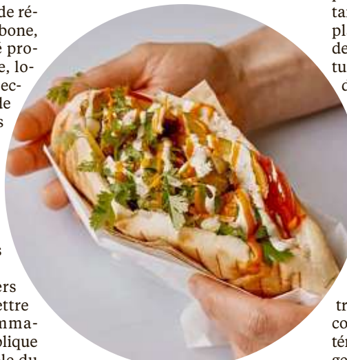
Un kebab sauce végane.

49 restaurants ont été sélectionnés pour ravir les papilles des festivaliers, dont une majorité n'a initialement pas de cartes végétariennes. Accompagnés d'une « map pieuvre » recensant