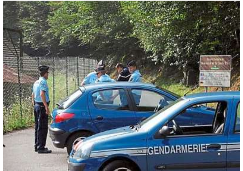
Des gendarmes sur les lieux de la tuerie de Chevaline, le 6 septembre 2012.