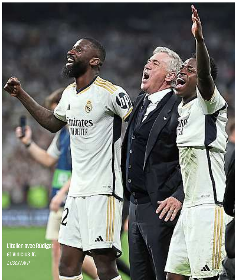
L'italien avec Rüdiger et Vinicius Jr.

Bordeaux, Elie Baup complète : « La gestion humaine du groupe par Ancelotti comme par Zidane est essentielle. Leur manière de manager permet de maintenir tout le monde concerné et performant. » Sur ce point, derrière les phénomènes Jude Bellingham et Vinicius, les exemples d'individualités aussi improbables que décisives ne manquent pas. À commencer par Joselu, no name par excellence, auteur d'un doublé dans les dix dernières minutes de jeu pour retourner la demi-finale retour contre le Bayern (2-1). Et que dire d'Andriy Lunin, invité surprise de cette campagne après la grave blessure de Thibaut Courtois en début de saison. Monstrueux face à City en quart, avec huit arrêts, dont deux